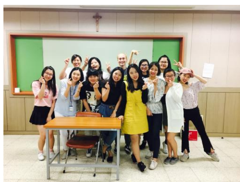
←韓語班上的老師及同學們。

加圖利大學也很貼心的為交換生舉辦語言班，韓語班是在每周一到周四晚上 6 點到 8 點，依照語言能力分 1 至 5 級，只有學過基礎中的基礎的我，當然是在第一級囉！